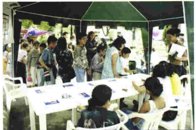
La 2da. Jornada Cívica Estatal Infantil y Juvenil contó con una entusiasta participación

La Jornada Cívica Estatal Infantil y Juvenil tuvo una amplia difusión a través de dos programas de radio que se transmitieron en los municipios de Zacatecas, Jerez, Tlaltenango y Jalpa; así como de diversos spots cuya transmisión superó los 1500 impactos.